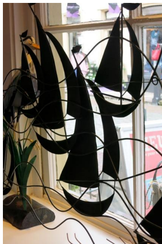
De etalage bij het Botterweekend. De scheepjes waren echter zo verkocht.